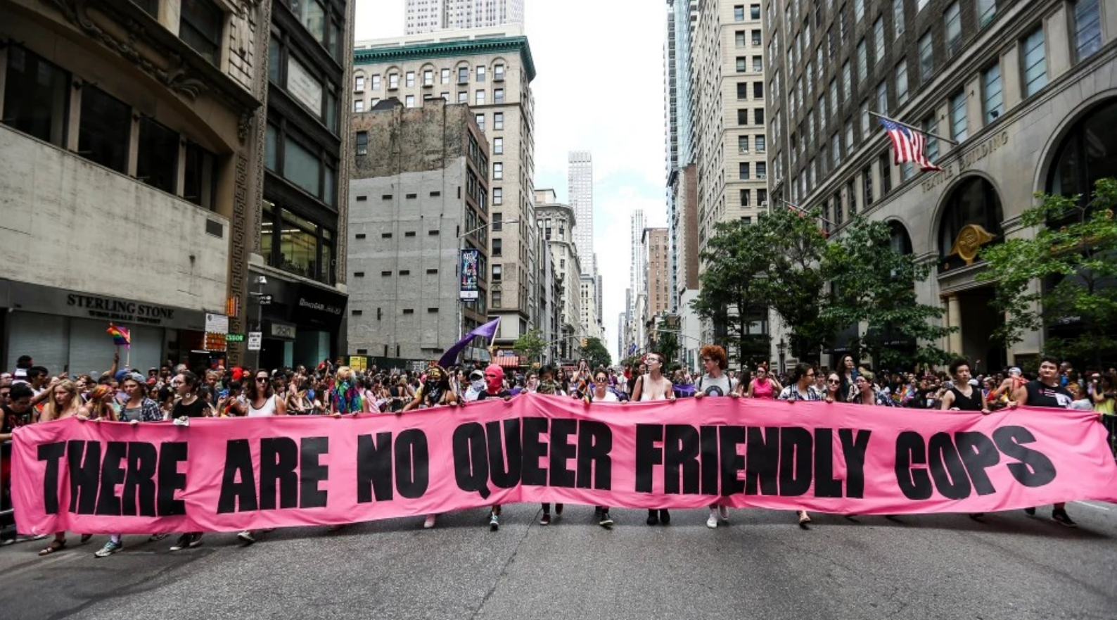
Faixa com a frase "Não existe policiais amigos de pessoas queers."

Essa abordagem do transfeminicídio recusa a privatização da violência anti-trans na forma de uma infração de direitos praticada por um agente individual da violência, e responsabiliza sua dimensão cis-têmica, organizada, codificada nos aparelhos do Estado.