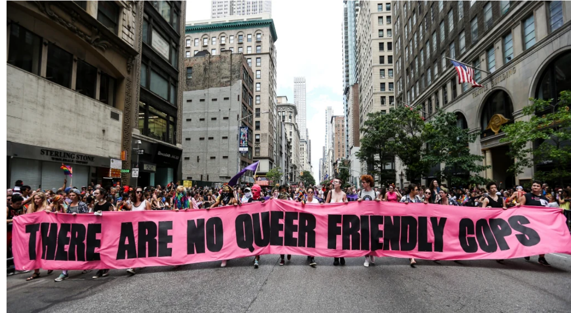
Faixa com a frase "Não existe policiais amigos de pessoas queers."

Essa abordagem do transfeminicídio recusa a privatização da violência anti-trans na forma de uma infração de direitos praticada por um agente individual da violência, e responsabiliza sua dimensão cis-têmica, organizada, codificada nos aparelhos do Estado.